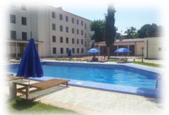
Азия Самарканд 3*